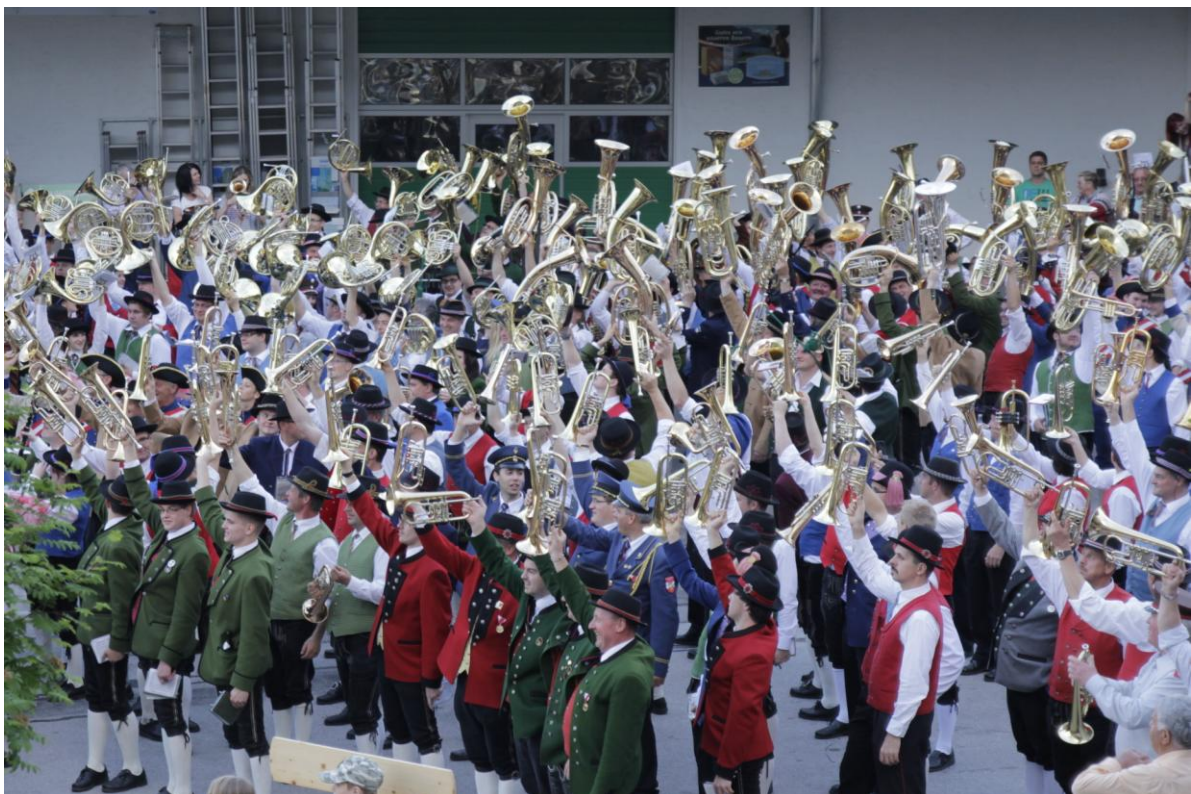
Instrumente „HOCH“ beim Gesamtspiel