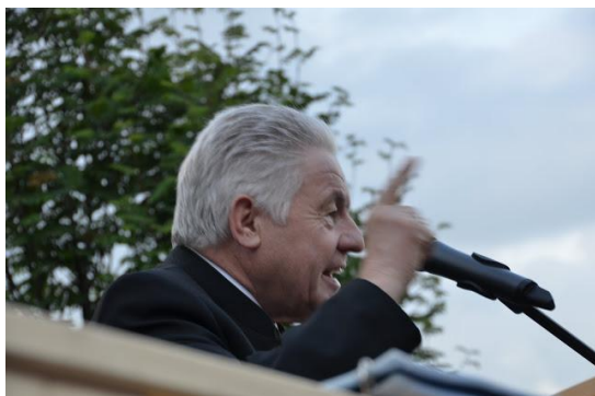
LH Dr. Josef Pühringer bei seiner Festrede