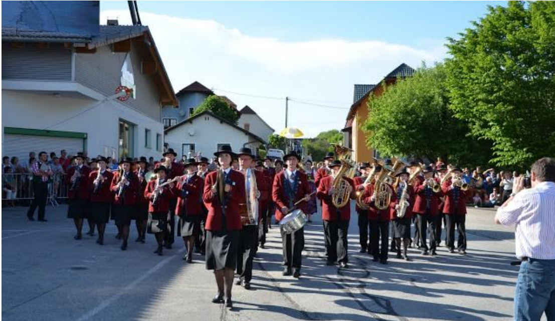
Unsere Musikkapelle bei der Formation „Flieger“

Als Figur wurde ein Flieger einstudiert, zu dem die Musikstücke „Mein Heimatland“ und „Berglandkinder“ gespielt wurden. Von den teilnehmenden Musikkapellen in der Wertungsstufe E hat unsere Musikkapelle mit 91,90 Punkten die dritthöchste Punktezahl erreicht und damit einen „ausgezeichneten Erfolg“. Entsprechend groß war die Freude.