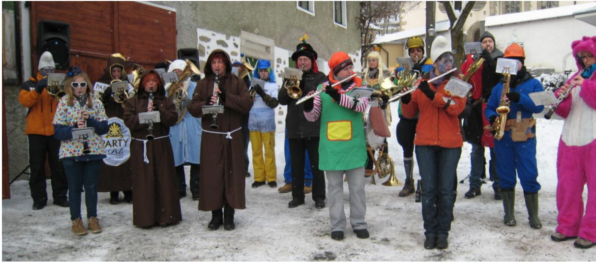
Unsere Musiker beim Musizieren in Faschingskostümen