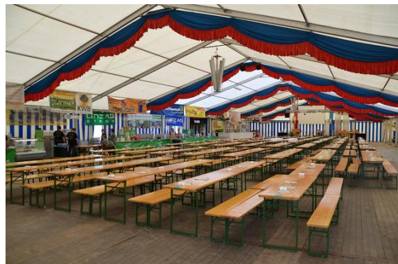
Alles ist bereit für den großen Andrang!