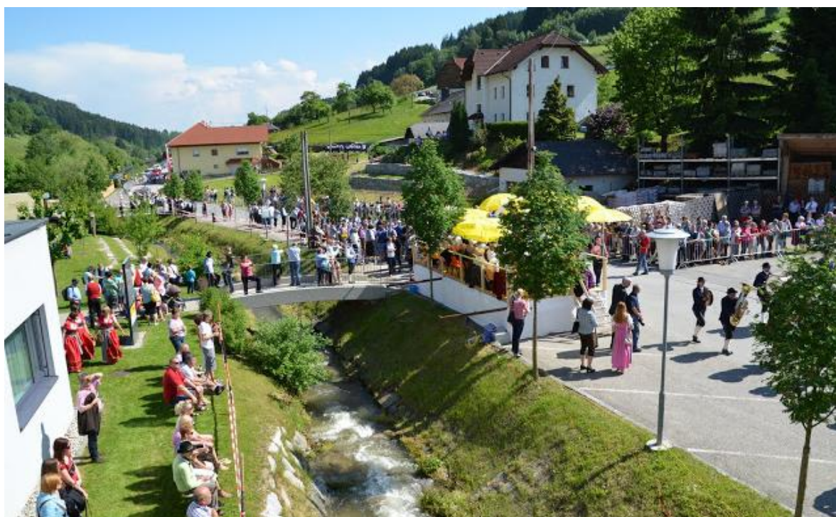
Blick auf dem Marschwertungsbereich