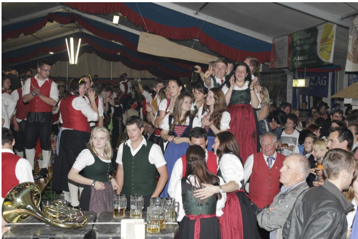
ausgelassene Feierstimmung im Festzelt