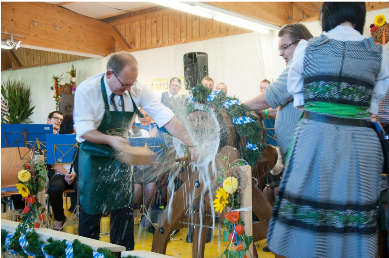
...und „nass“ beim Bieranstich