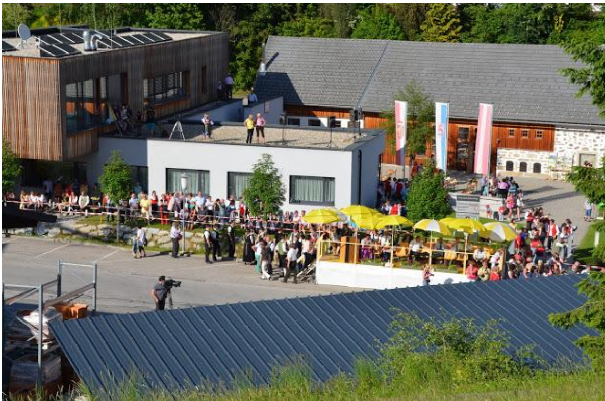
Wertungsgelände am Zülowplatz

Ca. 1100 Musiker und Musikerinnen sorgten mit ihren Trachten und ihren Darbietungen auf dem Zülowplatz für eine bunte Vielfalt, welche die teilweise längeren Gehzeiten unserer Besucher zum Wertungsgelände schnell zum Vergessen brachten.