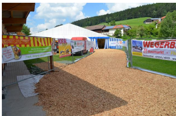
Zugang zum Festzelt