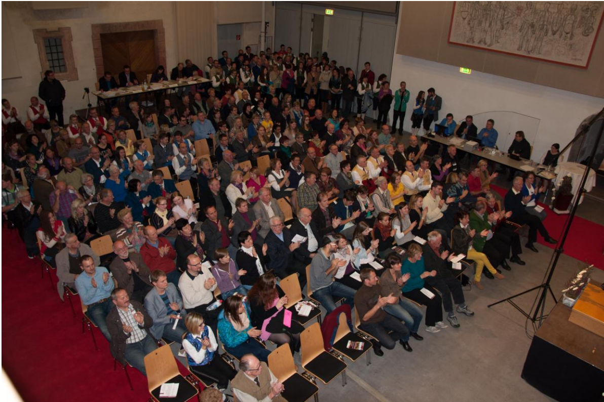
reger Besuch an Zuhörern