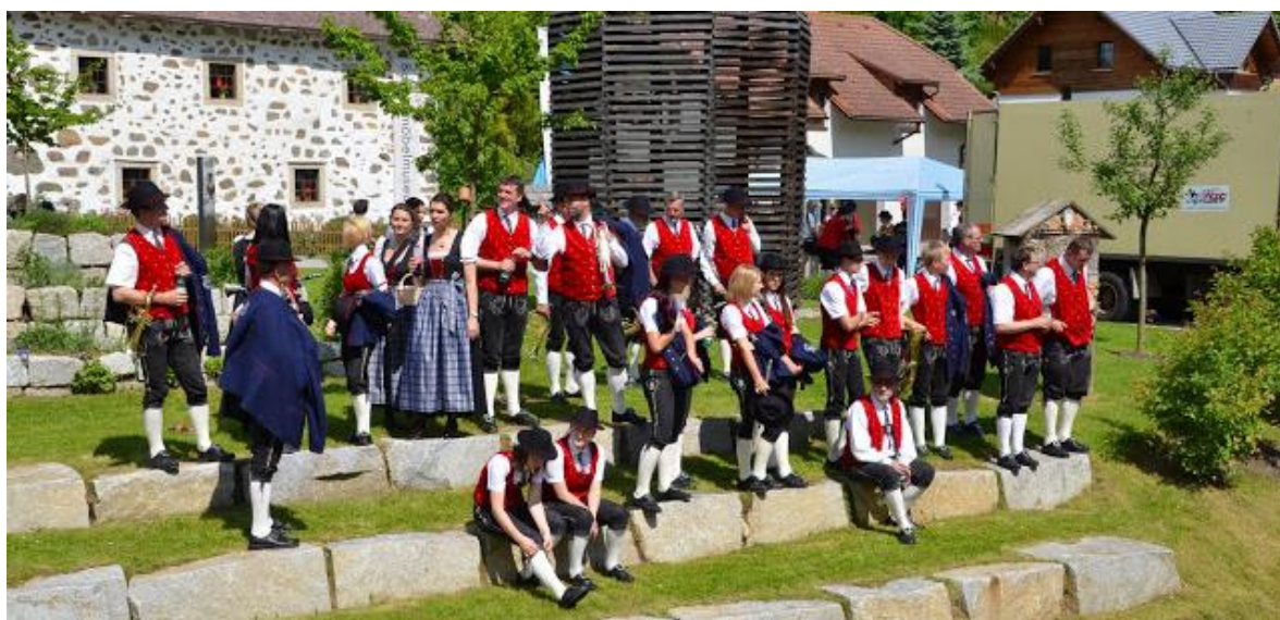
Interessierte „Mitbewerber“ beim Beobachten der „Konkurrenz“