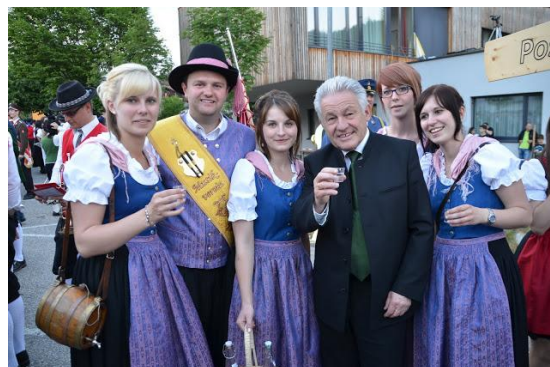
...und bei einer kleinen Stärkung