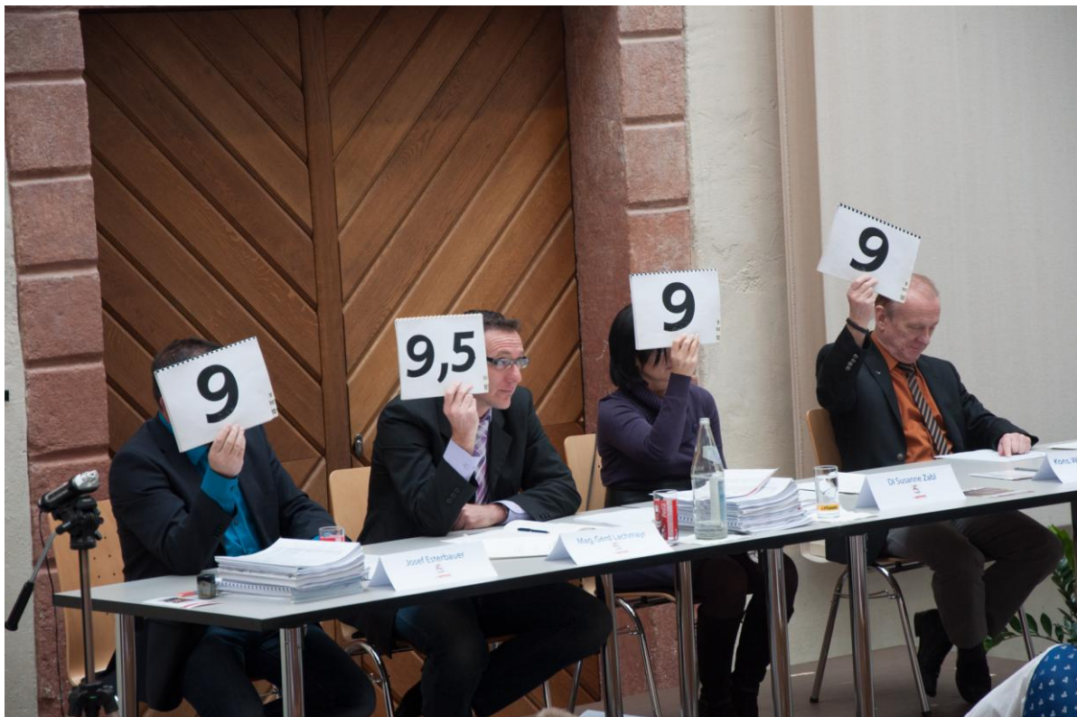
Die Fachjury bei der Punktevergabe