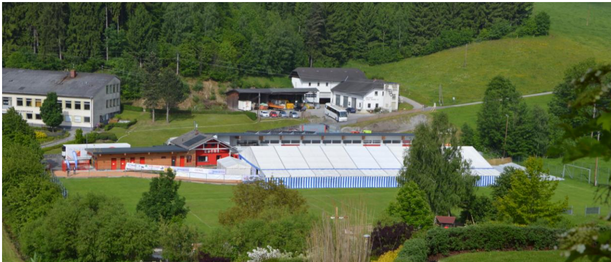
Das Festzelt am Sportplatz

Für den Aufbau des Zeltes waren z.B. 40 Helfer erforderlich. Um die Gäste entsprechend bewirten zu können waren am Samstag insgesamt ca. 200 Personen im Einsatz. Das Festzelt mit einer Größe von 50x24m, welches am Sportplatz aufgestellt wurde, bot Platz für ca. 1100 Sitzplätze.