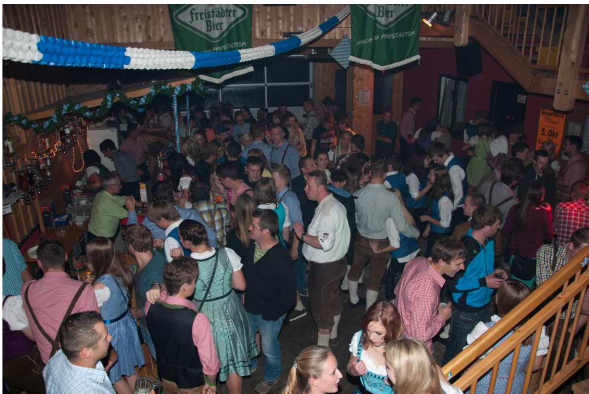
tolle Stimmung in der Bar