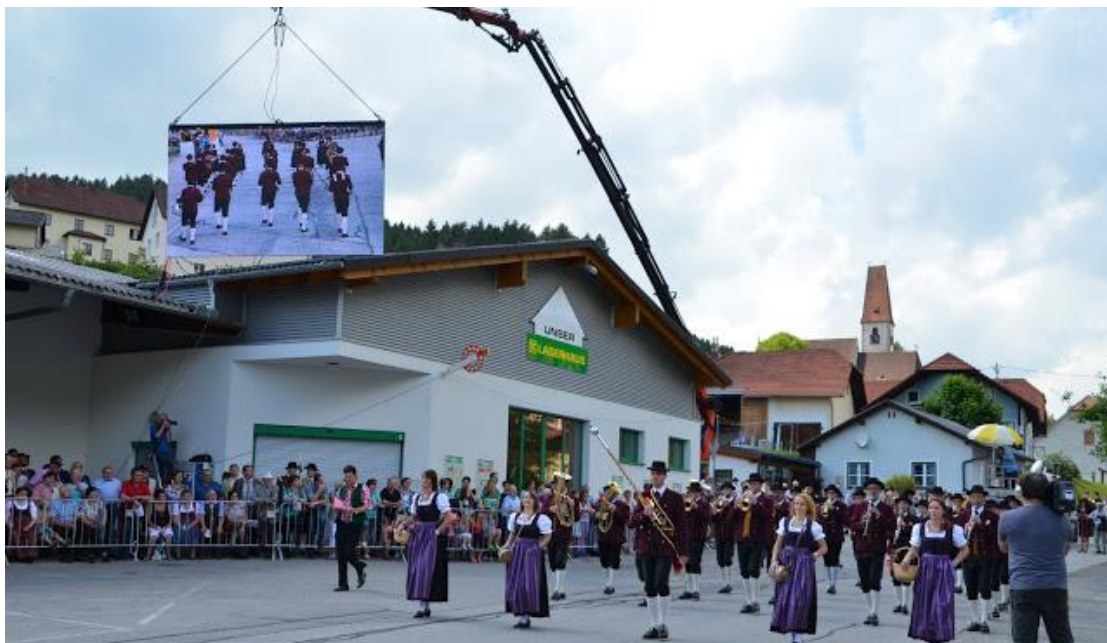
Zur besseren Visualisierung für die zahlreichen Zuschauer war extra eine große Videowall über dem Lagerhaus installiert worden