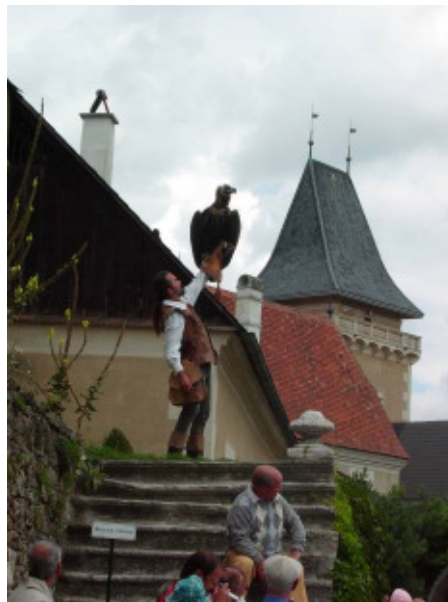
Greifvogelschau auf der Rosenberg