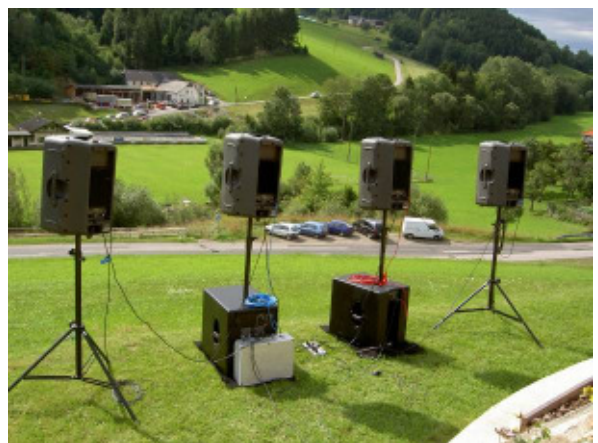
Obm. Manfred Ziegler am Mischpult und rechts die Lautsprecher für die „Klangwolke“