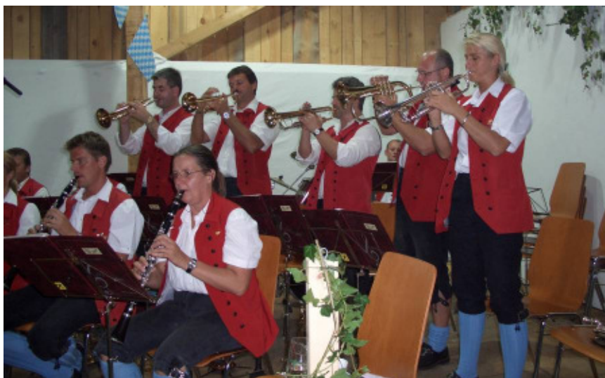
Die „Bierbrezenmusi“ aus Bad Leonfelden