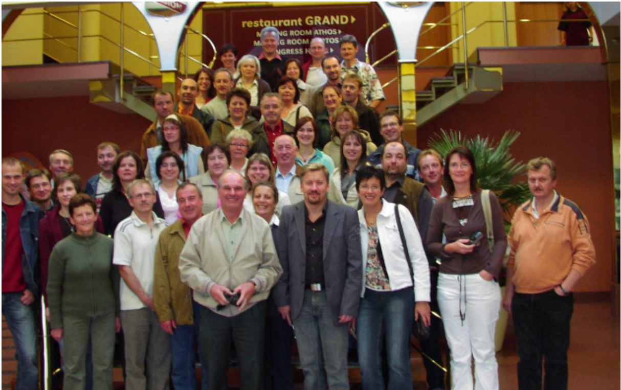
Die Teilnehmer am Ausflug, im Foyer des Hotels ALBION

Altstadtführung, Karlsbrücke, Nikolauskirche Schiffahrt auf der Moldau