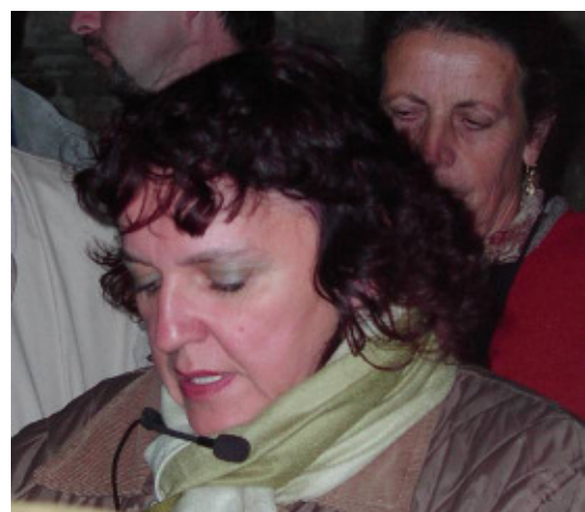
Unsere Reiseleiterin in Prag