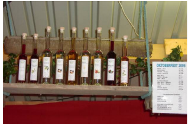
Das Angebot in der Schnapsbar