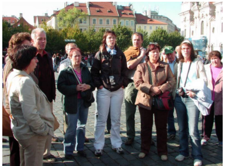
Unsere Sänger bei einer Gesangseinlage in der Altstadt